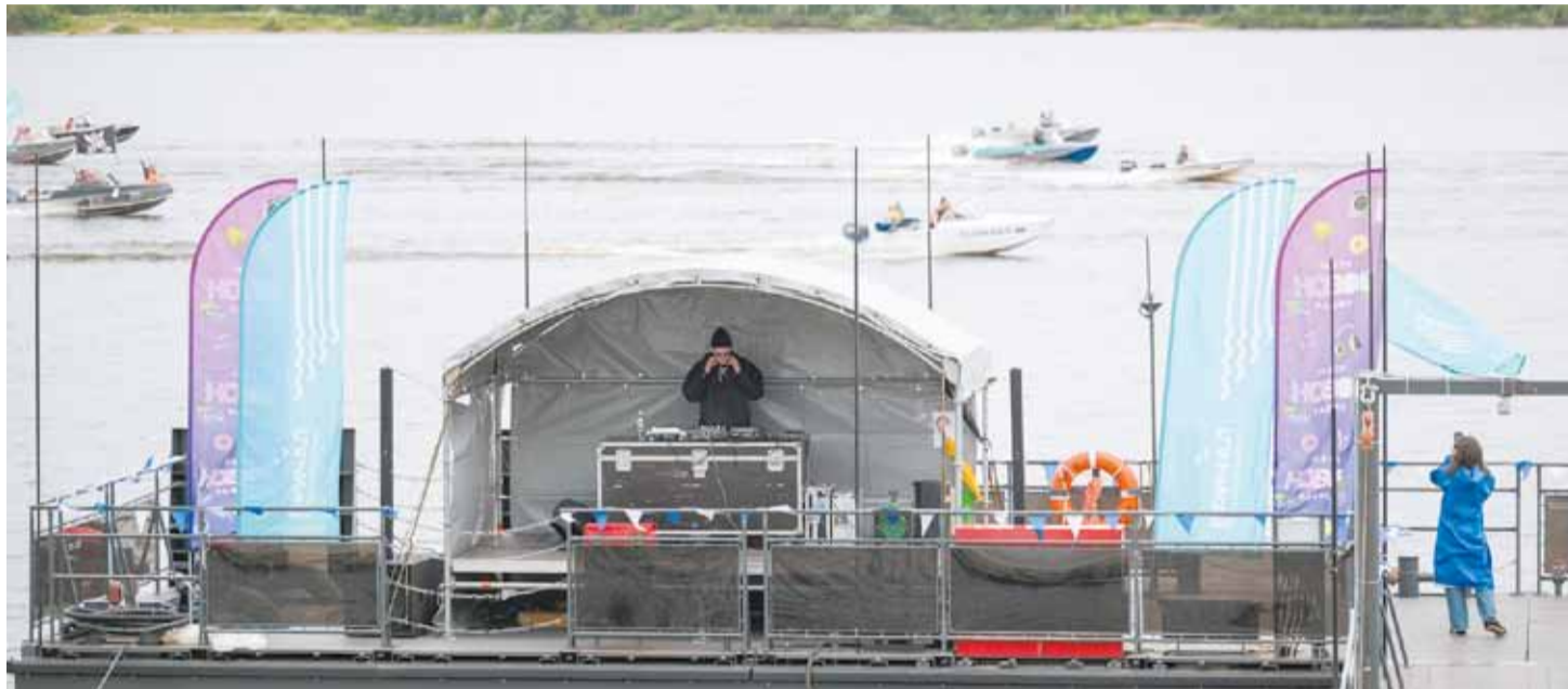
Музыкальный фестиваль «Причал»

Кроме музыкальной части гостей ждали экскурсии по Закамску, в затон и на Судостроительный завод,