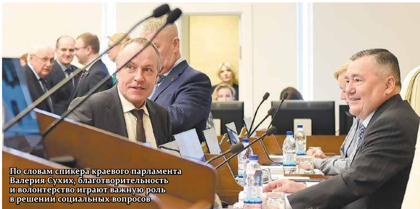
По словам спикера краевого парламента Валерия Сухих, благотворительность и волонтерство играют важную роль в решении социальных вопросов

«В Пермском крае более 400 тыс. человек вовлечены в эту сферу деятельности. Устанавливаются дополнительные меры поддержки и социальные гарантии тем волонтерам, которые рискуют своим здоровьем, оказывая помощь в лечебных учреждениях,