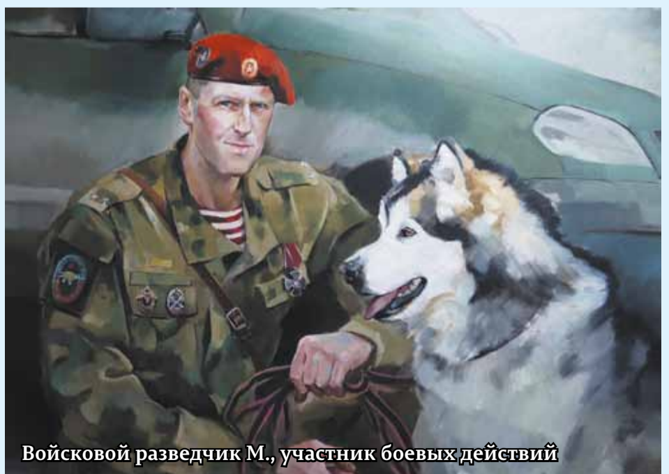
Войсковой разведчик М., участник боевых действий