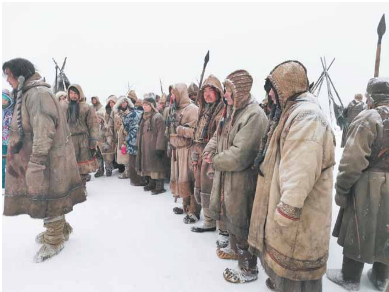
Съемки фильма «Сердце Пармы» (16+)

При этом многое изменилось в отношении к уральскому геокультурному ресурсу в кино. Если