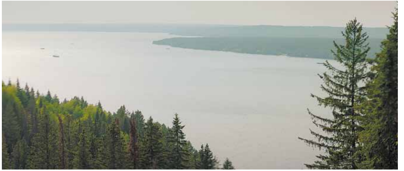
Кадр из фильма «Культурная комедия» (12+)

«прибытие», и оно как раз связано с приходом в город большого кино.