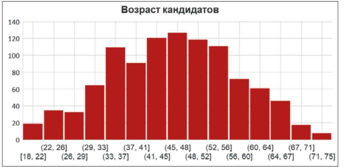
Инфографика – Business Class, на основе данных ЦИК РФ.

ступило 15 обращений, большинство из которых касались незаконной агитации, остальные – по вопросам регистрации на ДЭГ, предоставления информации о выборах и уточнения сведений в списке избирателей. По всем обращениям заявителям дали разъяснения или оказали содействие в урегулировании.