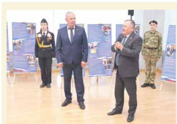
Спикер и вице-спикер краевого парламента Прикамья Валерий Сухих и Сергей Яшкин на презентации выставки «Герои на все времена»

В двух чтениях парламентарии одобрили инициативу фракции ЛДПР об установлении дополнительных ограничений розничной продажи алкогольной продукции в объектах общественного питания, расположенных в многоквартирных домах и на прилегающих к ним территориях.